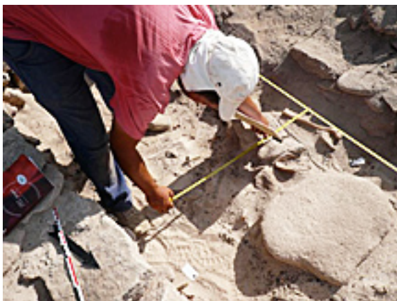
Thomas étudiant les restes humains

La fin de semaine approche, sans doute salubre, car après les efforts fournis par toute l'équipe, un peu de repos ne fera de mal à personne.