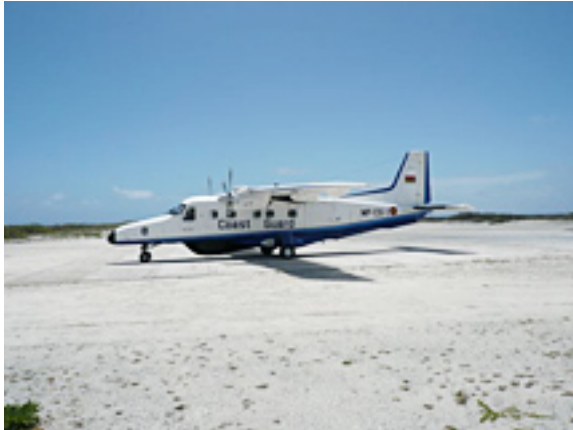
Avion des «coast guards» mauriciens

Nous avons décidé de remblayer les bâtiments avec du sable pour mieux les protéger et pour éventuellement les dégager plus facilement. Le rude travail de terrassier reprend.